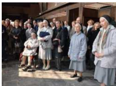
Acto de cierre