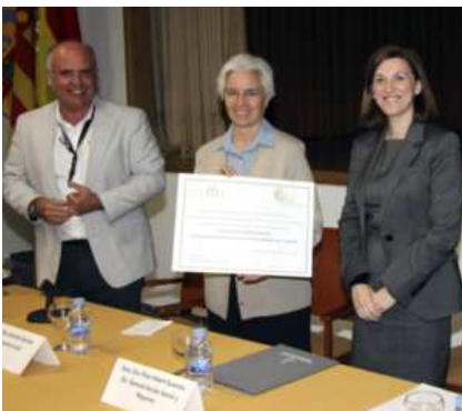
Acto de entrega de la acreditación

El centro sociosanitario Ntra. Sra. del Carmen de Valencia, España, ha recibido la acreditación "Cen-