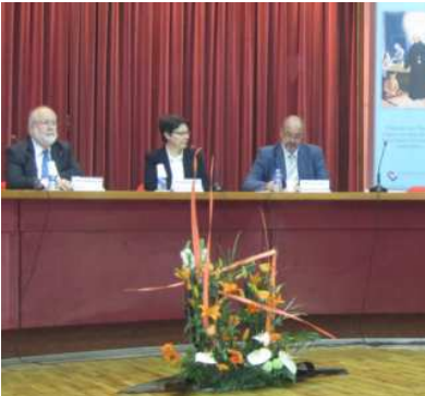
Acto de inauguración

El medio siglo de historia del centro, así como la evolución de la atención psiquiátrica a lo largo de este tiempo, fueron los ejes centrales de la inauguración de los actos de celebración del 50 aniversario del Hospital Sagrat Cor de Martorell, España, que tuvo lugar el 24 de abril coincidiendo con la festividad