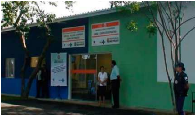
Fachada del complejo

La unidad dirigida a la asistencia de personas indigentes y drogodependientes de la región central de São Paulo "Complejo Prates" cumple un año de funcionamiento.