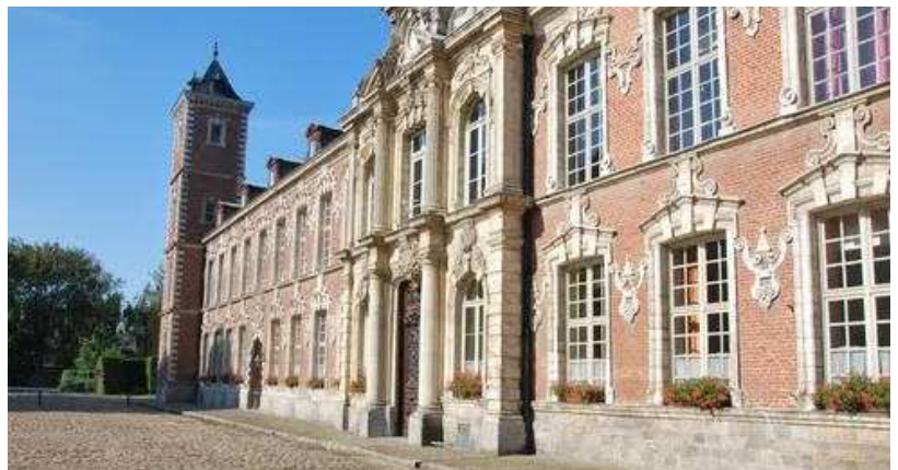
Hospital de Nuestra Señora de Seclin