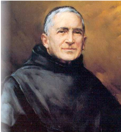
San Benito Menni