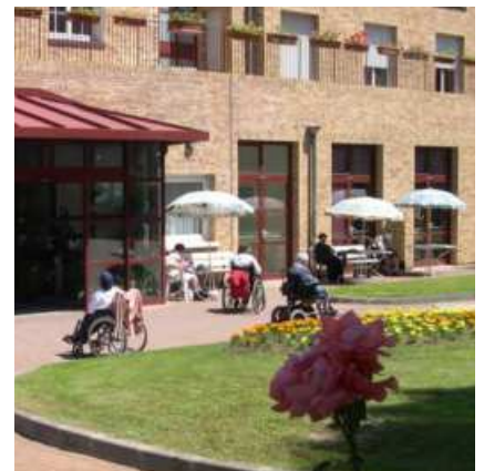
Casa Sainte Germaine

regala y generosidad. Un voluntario no representa superioridad ni autoridad, sino una ventana abierta al mundo exterior, una escucha sin juicio y una presencia afectuosa.