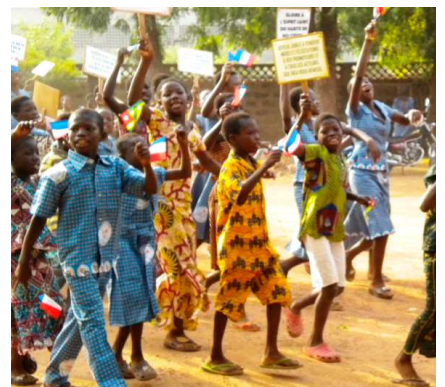
Celebración 50 aniversario de la llegada de las Hermanas Hospitalarias