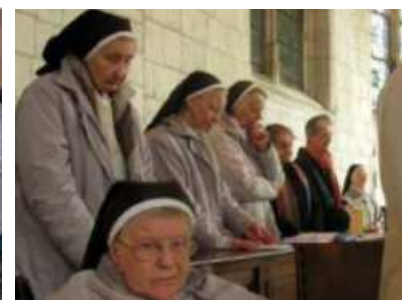
Celebración de la Eucaristía