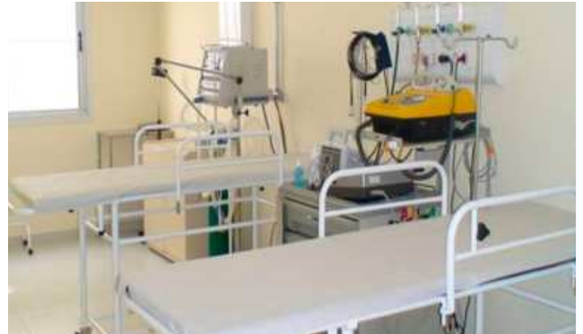
Unidad de ayuda a personas con adicciones

El proyecto que nació de una asociación entre las Hermanas Hospitalarias y el Gobierno del Municipio de São Paulo, tiene como objetivo proporcionar una asistencia digna y humana a las personas que están en la calle y a los drogodependientes de la región central de São Paulo.