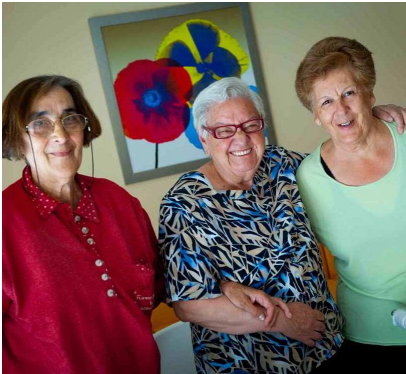
Usuaris del centro

El centro Benito Menni de Valladolid, España, ha inaugurado una nueva unidad, con quince