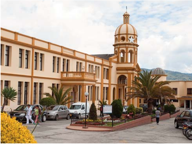
Entrada al Hospital Nuestra Señora del Perpetuo Socorro

El Hospital Mental Nuestra Señora del Perpetuo Socorro ubicado en Pasto, Colombia, fue fundado en 1949 por las Hermanas Hospitalarias y es el primer centro de la Institución en América Latina.