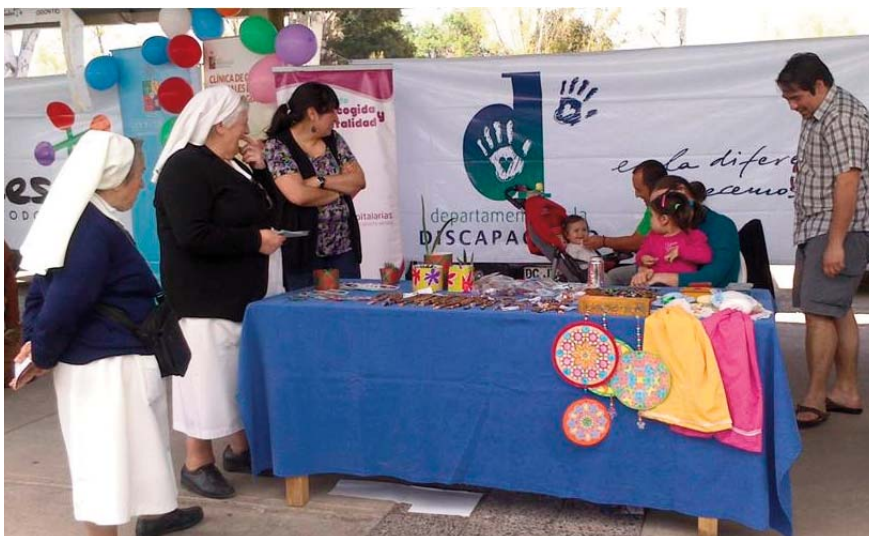
Feria de Discapacidad en Las Condes

La Red de Salud Mental San Benito Menni de Chile, muestra su trabajo en la Feria de Discapacidad en la comunidad de Las Condes. Este encuentro, organizado por la Municipalidad de Las Condes, convoca a instituciones ligadas a la Discapacidad de toda la Región.