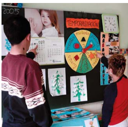
Fundación Purísima Concepción