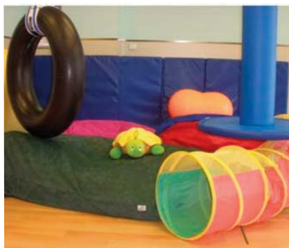
Sala de integración sensorial

El pasado 28 de febrero, el Centro Hospitalario Benito Menni de Valladolid, España, inauguró la primera sala de integración sensorial en Castilla y León.