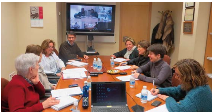
Comité de Ética Asistencial