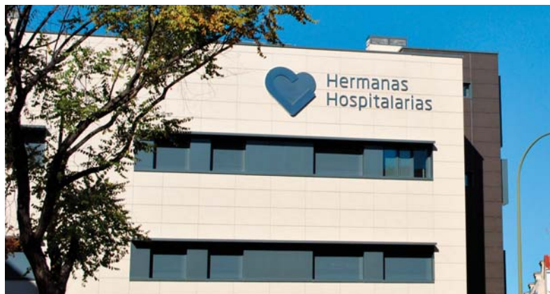
Fachada Centro Retiro

Retiro es uno de los nueve centros de trabajo dirigidos desde la Clínica San Miguel - Línea de Rehabilitación Psicosocial (LRHP) de la Provincia Canónica de Madrid.