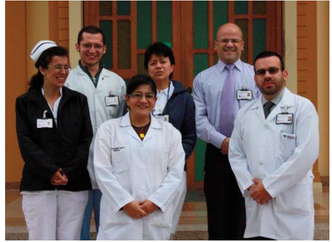
Personal del Hospital Nuestra Señora del Perpetuo Socorro

Actualmente, 4 hermanas y 167 colaboradores llevan a cabo la misión de este Hospital, que cuenta con la certificación de calidad ISO 9001. Es un componente vital en la red de prestación de servicios de salud en la parte occidental de Colombia y el norte del Ecuador, por el tipo de patologías