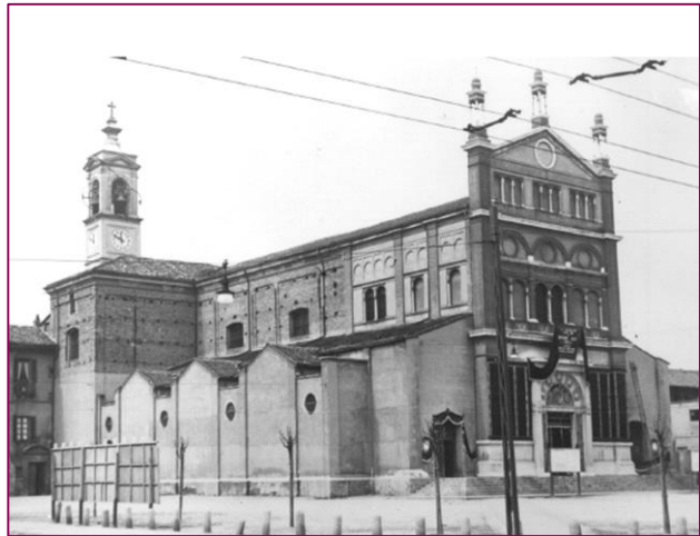
Iglesia "Santa María alla Fontana"

El 26 de junio de 1849, recibió el sacramento de la confirmación. Entre 1852 y 1857 asiste, con óptimos resultados, al instituto público de "Porta Nuova". Ya con su título no tiene dificultades para encontrar, a los dieciséis años, su primer puesto de trabajo, en un banco.