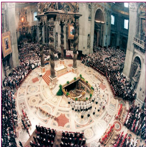
Actos de la canonización

El 23 de junio de 1985 fue declarado beato por el Papa Juan Pablo II y el 21 de noviembre de 1999 lo canonizó , acto por el que se reconoció ante la Iglesia su santidad, que vivió en grado extraordinario. ¡GRACIAS SAN BENITO MENNI!