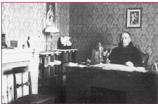
Benito Menni en su despacho, siendo Superior general