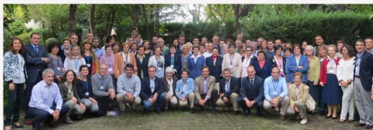
Asistentes, segundo grupo, del Curso Interprovincial del Marco de Identidad de la Institución.

Los Consejos de Dirección de las tres Provincias Canónicas de España reciben formación en el Marco de Identidad.